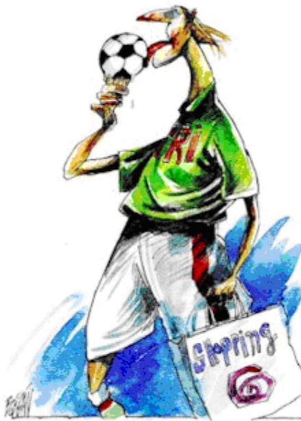
Copacabana Eiskreation WM 2014